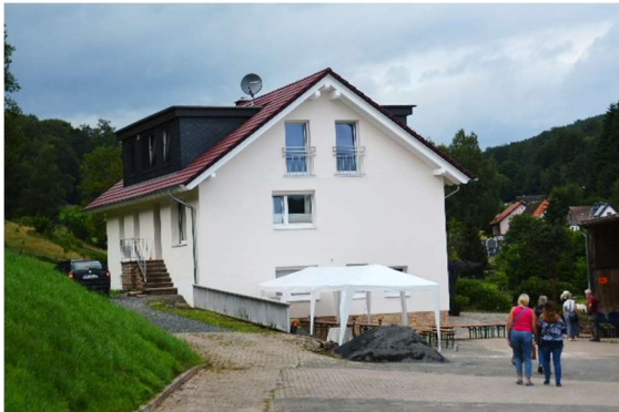
... von Süden

Hier noch einige Ansichten vom Wohnhaus, der "Schutzhütte" in Amelith: