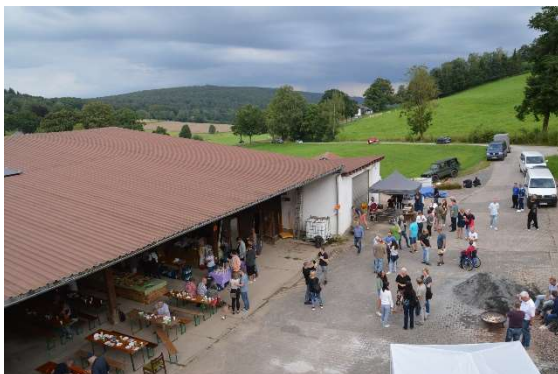
Blick aus dem Fenster nach Süden