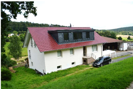
... von Westen