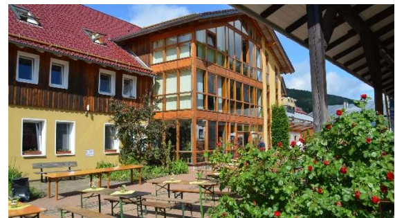
Amelith am Morgen, bevor alles losging