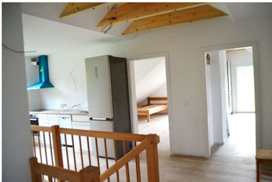
Innenansicht (im Dachgeschoss)