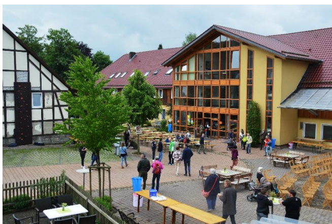
TAG DER BEGEGNUNG: 25.05.24 – 1. Samstag nach Pfingsten Neues Land Amelith

E in sehr bewegtes Jahr geht zu Ende. Wir haben viel erlebt. Einiges durften wir euch in diesen "Mitteilungen" weitergeben. Es ist nur ein Ausschnitt, dessen sind wir uns gewiß. Wenn ihr ein Stück mehr miterleben möchtet, nehmt doch bitte die Termine links wahr. Eine persönliche Begegnung und ein persönliches Erleben schafft noch immer einen anderen Grat an Verbundenheit und des Einblicks. Wir heißen euch also herzlich willkommen, z. B. zum Neujahrsempfang (siehe links) zu kommen!