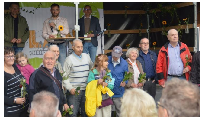
Sie haben alle einmal mitgeholfen