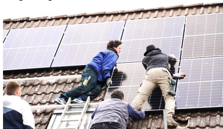
Beim Einrüsten mit Photovoltaik in Schorborn