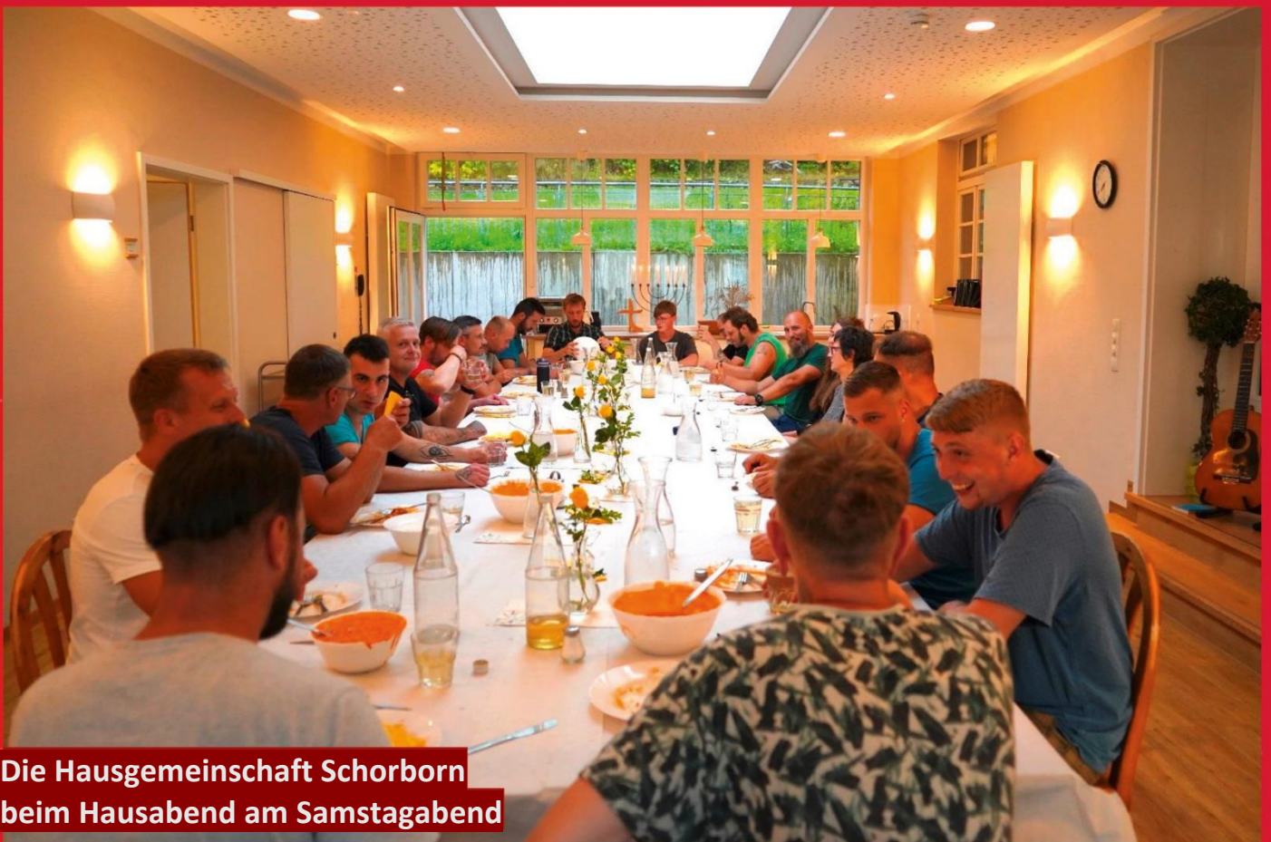
Die Hausgemeinschaft Schorborn beim Hausabend am Samstagabend