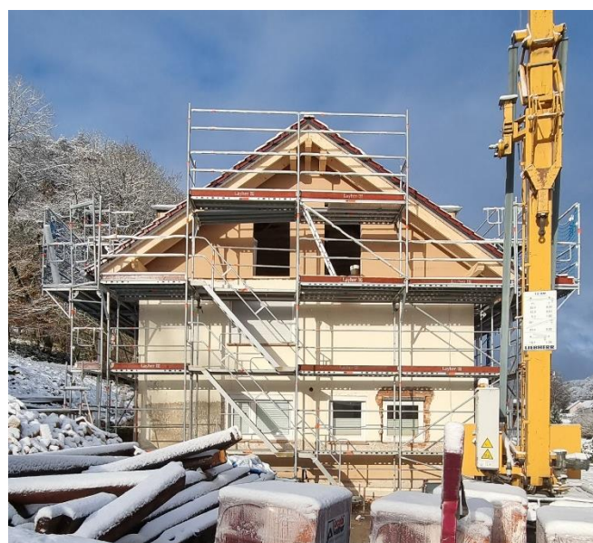
Das Wohngebäude des Aussiedlerhofes in Amelith im winterlichen Ausbau. In den nächsten "Mitteilungen" mehr dazu...

I nzwischen ist der Winter eingekehrt und der Advent und das Leben bekommt immer wieder neue Reize und Erfahrungen.