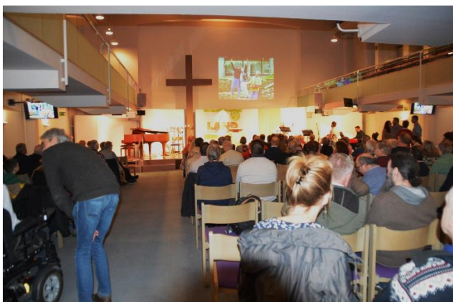
Neujahrsempfang: Freitag, 26.01.24, 18.00 Uhr Gemeindehaus Walderseestr. 10, Hannover