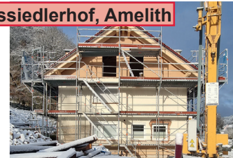
Schutzhütte Aussiedlerhof, Amelith