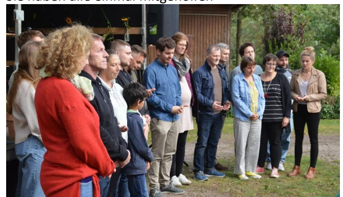
Bewohner u. Mitarbeiter des Hauses jetzt