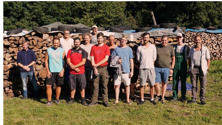
Beim "Erntedank" der Männer in Schorborn für das geschlagene Holz.