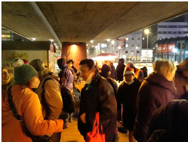
"Christmas in the City": 19. – 24.12.23

H ier die nächstliegenden Termine im Neuen Land: Bitte notieren und reservieren. Wir freuen uns über jeden, der kommt!